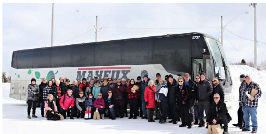
L'IMPOSANT GROUPE D'UNE CINQUANTAINE DE PERSONNES DE RETOUR À ÉVAIN