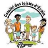
Comité des loisirs d'Évain

a pu profiter d'un moment de socialisation et de création. Rires, échanges spontanés et coups de pinceau appliqués entre deux gorgées de vin ont rythmé cette soirée conviviale.