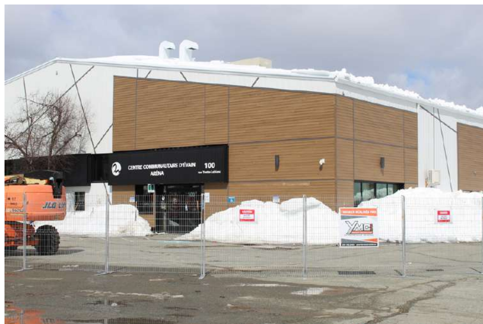
LES TRAVAUX DE NETTOYAGE ET D'INSPECTION SONT AMORCÉS ET AUCUN MEMBRE DES DIFFÉRENTS ORGANISMES N'EST AUTORISÉ À ENTRER POUR RÉCUPÉRER LEUR MATÉRIEL.