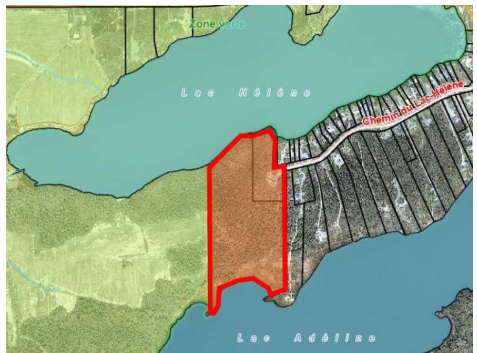
ZONE DE CONSERVATION