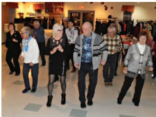
LE PARTY DE NOËL