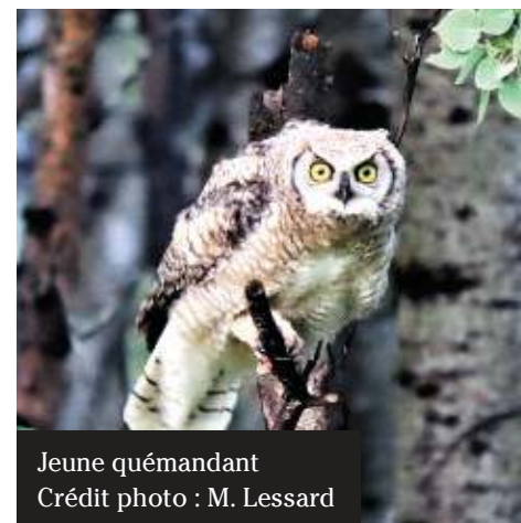
Jeune quémendant

Tout de même, il est agréable et réconfortant de savoir que l'on peut encore observer des espèces sauvages autour de nous, car ces oiseaux peuvent être vulnérables à la présence humaine. Ces grands hiboux ne sont pas seulement mystérieux, ils tiennent une place importante dans l'écosystème naturel. Donc respect et discrétion demeurent.