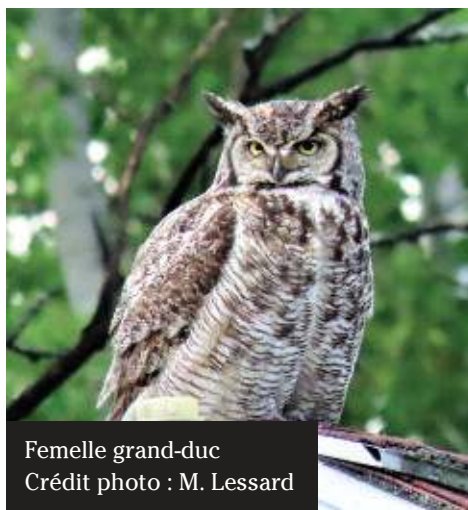
Femelle grand-duc

Ce grand oiseau de proie, beau et fort, met-il beaucoup d'efforts à la construction de son nid? Eh bien non, il se contente de prendre ce qui existe déjà, soit un vieux nid de corbeaux ou de rapaces ou encore, quand cela s'y prête, l'escarpement d'un rocher. Faute de confort, le doux et chaleureux plumage de la femelle permettra à un ou cinq œufs, le plus souvent deux, d'éclore dans un nid parfois bien fragile, au bout de 30 jours environ. Le grand-duc niche tôt en saison et il arrive que la famille se retrouve recouverte d'une couche de neige lors de la tombée des dernières neiges. Comme les oisillons arrivent avant l'apparition des feuilles aux arbres, cela a donné l'occasion, aux observateurs, de percevoir de petites boules de duvet qui se trémoussaient sous les côtés de la femelle. Plaisir certain. Ju-