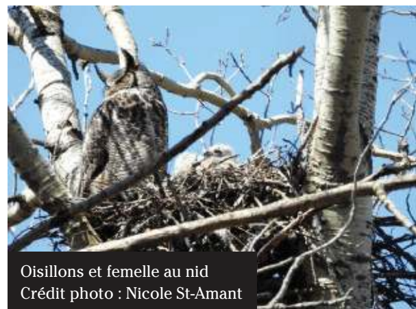
Oisillons et femelle au nid