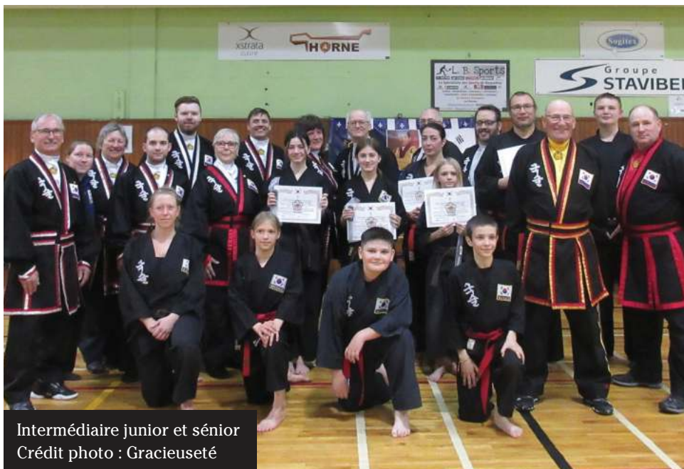
Intermédiaire junior et sénior

* SIKJN vient de Suhm Im kwahn Jahng Nym qui signifie en coréen « grand maître » ou encore 8 e Dahn.