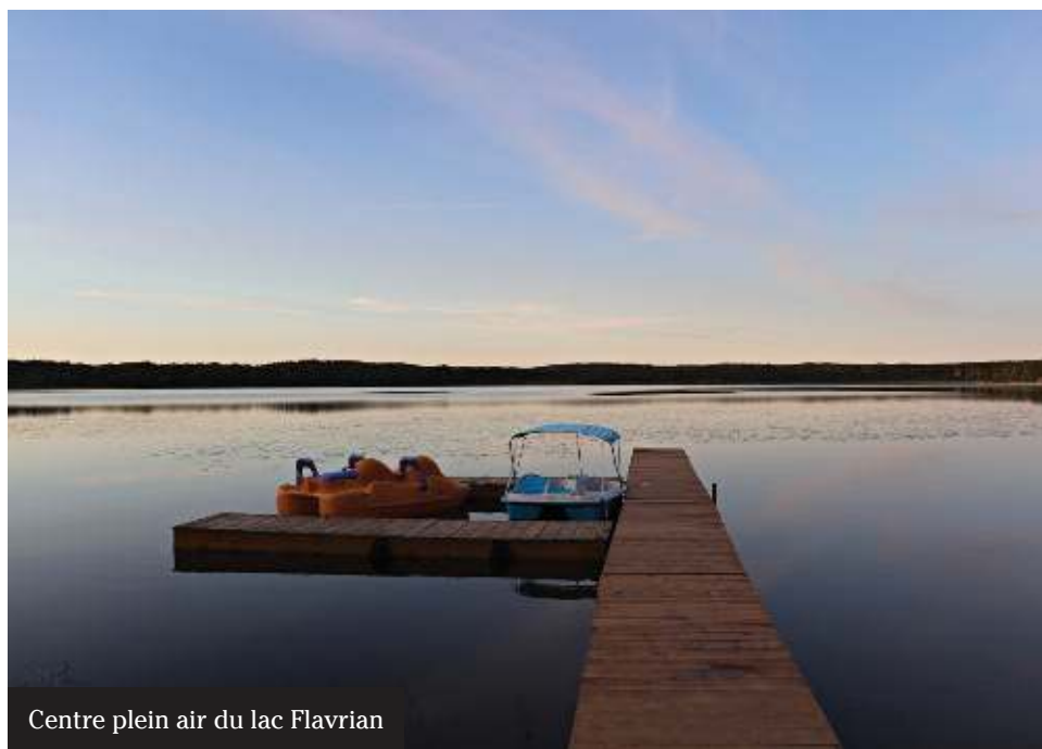
Centre plein air du lac Flavrian