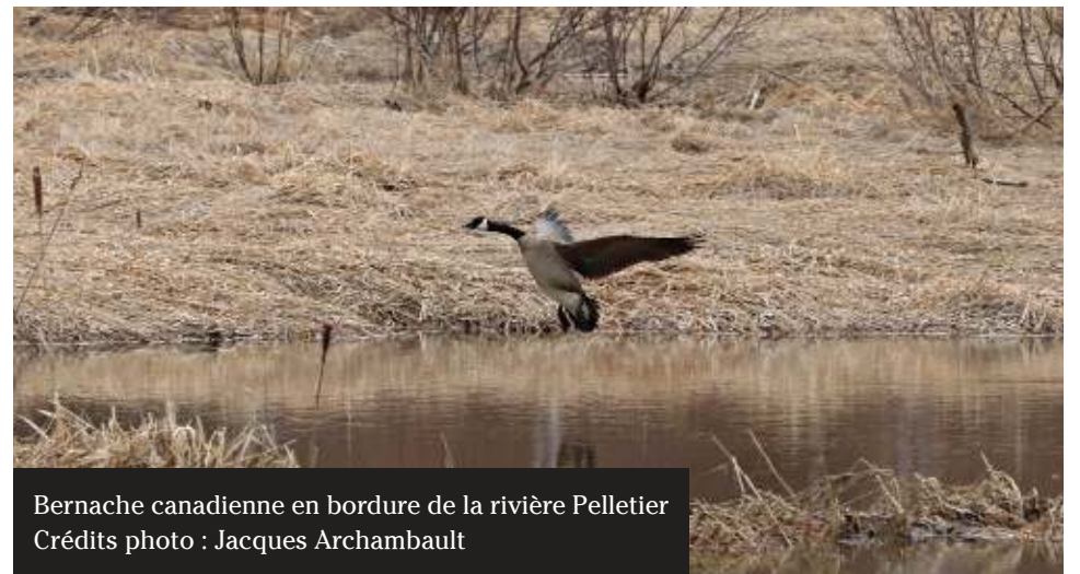
Bernache canadienne en bordure de la rivière Pelletier

www.environnement.gouv.qc.ca/eau/potable/index.htm