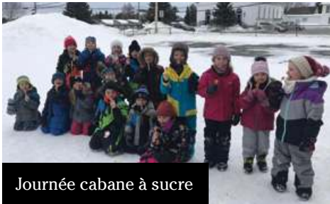
Journée cabane à sucre

Le 30 mars, dans les deux pavillons, on soulignait une journée thématique Cabane à sucre. Les élèves ont vécu différentes activités en lien avec ce thème. Certains chanceux ont même pu se sucrer le bec!