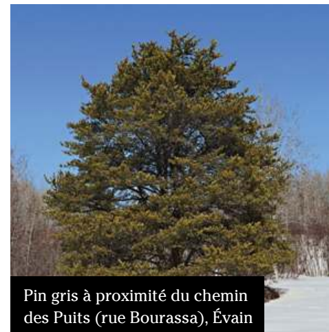
Pin gris à proximité du chemin des Puits (rue Bourassa), Évain

Si vous prévoyez planter un arbre, assurez-vous de connaître sa dimension une fois à maturité car, trop près de la maison ou encore à proximité d'un autre arbre, cela pourrait devenir un inconvénient. Il est suggéré un espace entre trois et cinq mètres (dix et quinze pieds) entre deux arbres.