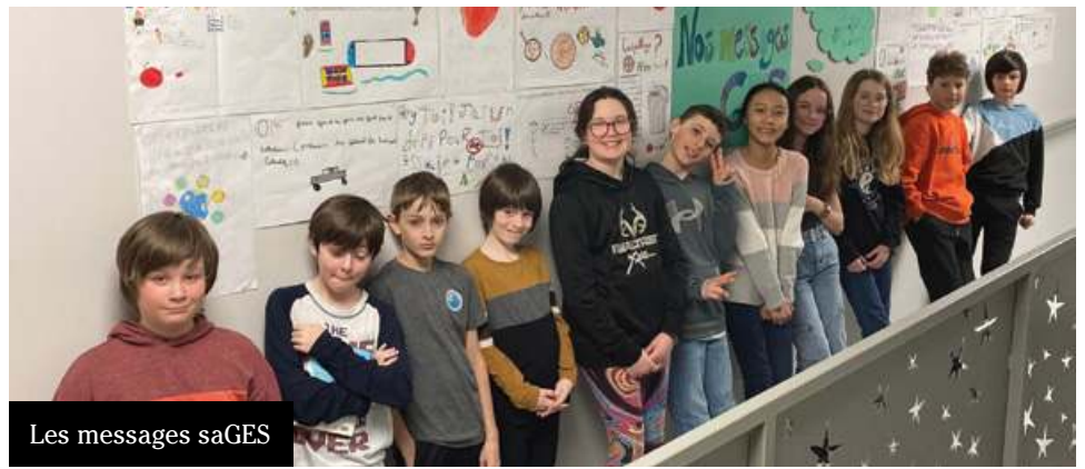
Les messages saGES

Les élèves de 5 e de la classe de Julie ont réalisé des affiches au sujet de l'environnement, visant à informer leurs lecteurs au sujet des émissions de gaz à effet de serre (GES) qui causent beaucoup de pollution. Il est important de réfléchir aux diverses solutions possibles pour protéger davantage notre belle planète. Ils invitent les élèves des autres classes à venir prendre connaissance de leurs messages saGES. Gageons qu'ils inspireront les autres classes à suivre le mouvement lors de la journée de la Terre en avril!