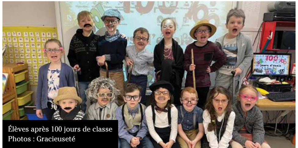
Élèves après 100 jours de classe

Les classes de préscolaire 5 ans ont vécu leur journée des 100! Ils devaient se déguiser en personnes âgées de 100 ans, et ont vécu toutes sortes d'activités qui les amenaient à exploiter le nombre 100. Une journée toujours très attendue des élèves!