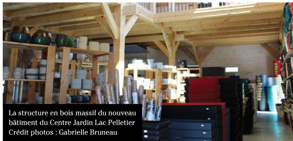
La structure en bois massif du nouveau bâtiment du Centre Jardin Lac Pelletier