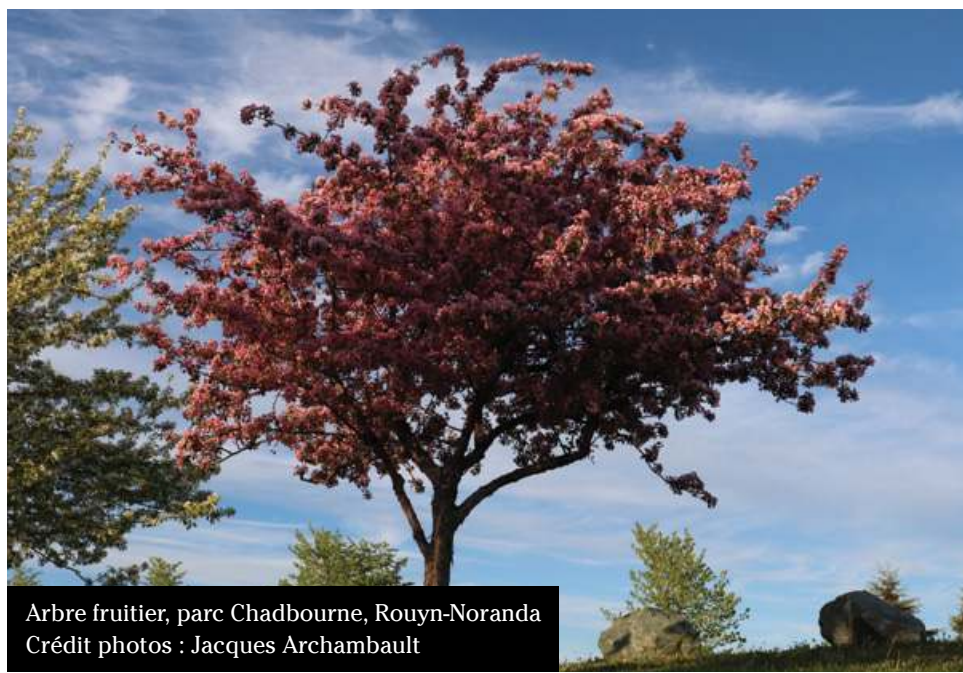
Arbre fruitier, parc Chadbourne, Rouyn-Noranda

Le plus vieil arbre répertorié au Québec se trouve dans notre région, plus spécifiquement en Abitibi-Ouest sur une île du lac Duparquet. Âgé de 913 ans (peut-être mille), c'est un petit thuya d'environ 2 mètres de haut doté d'une robustesse inouïe. D'autres thuyas âgés de 500 ans et plus y ont été découverts.