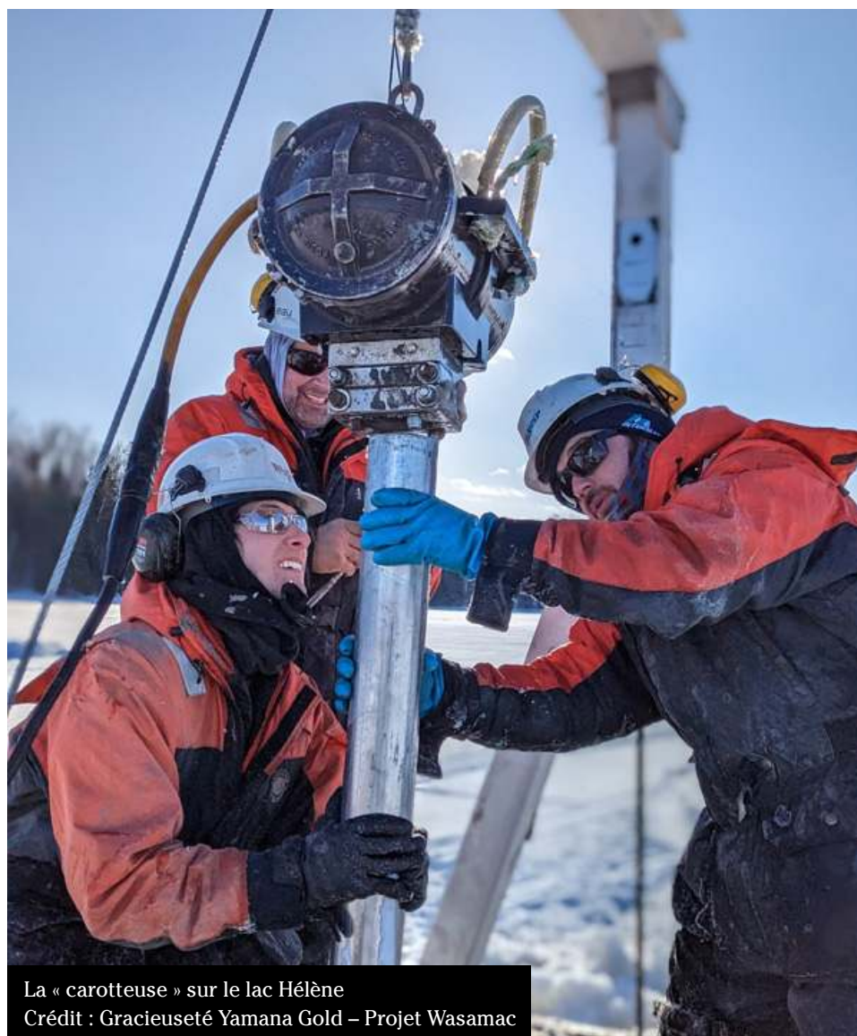
La « carotteuse » sur le lac Hélène

Ainsi, la seule certitude que nous puissions avoir est que l'échéancier du projet se voit repousser à plus tard.