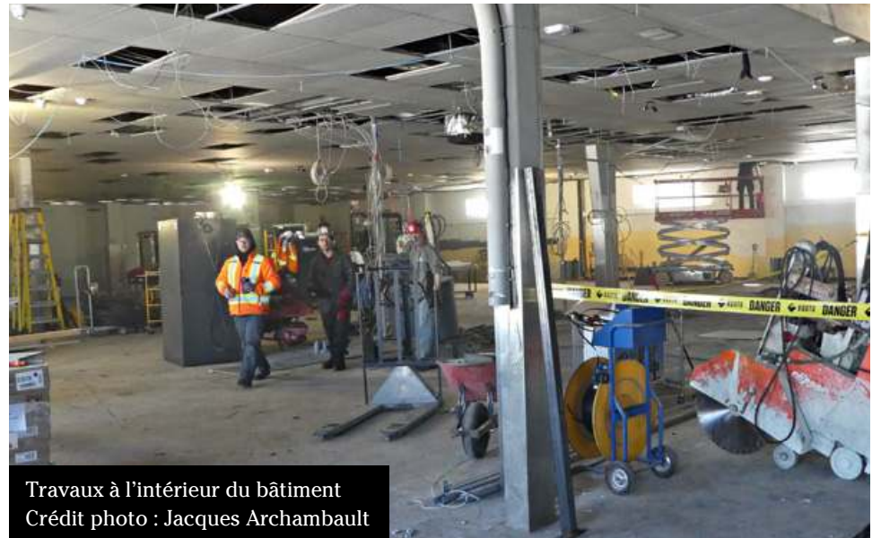
Travaux à l'intérieur du bâtiment