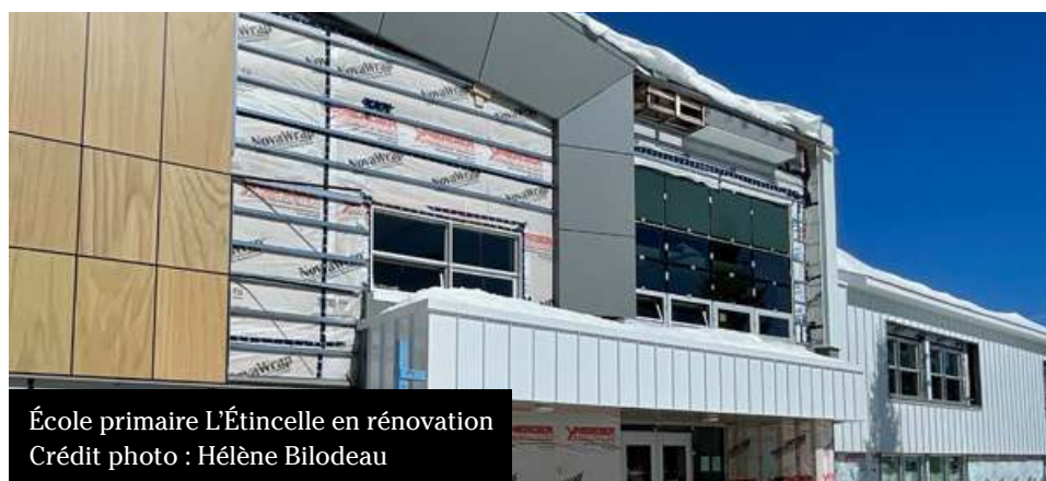
École primaire L'Étincelle en rénovation