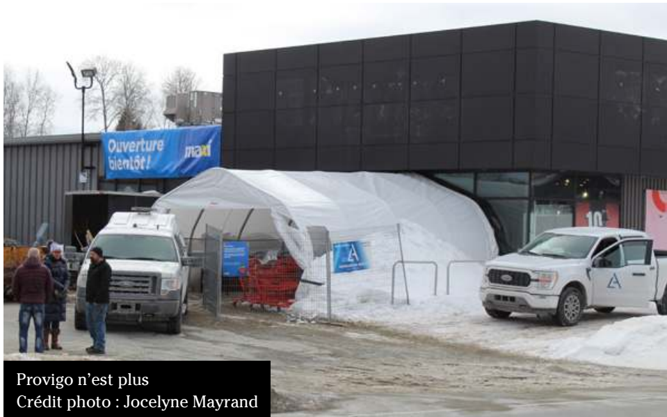
Provigo n'est plus