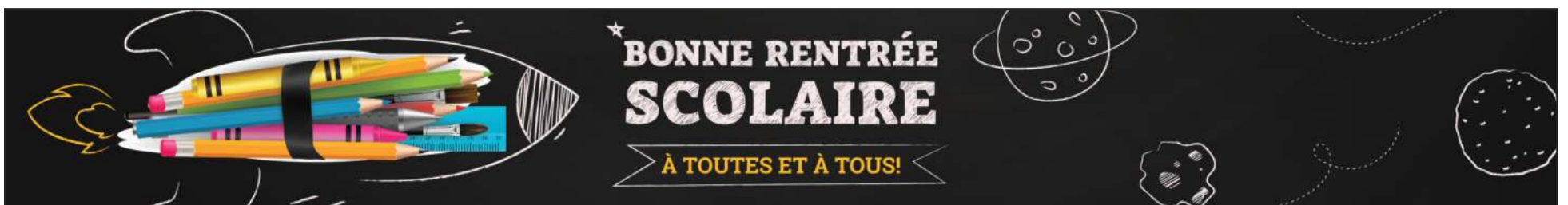
Articles en page 3