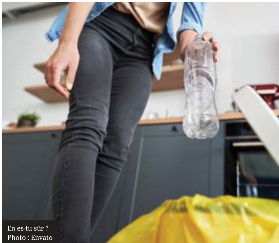
En es-tu sûr ?