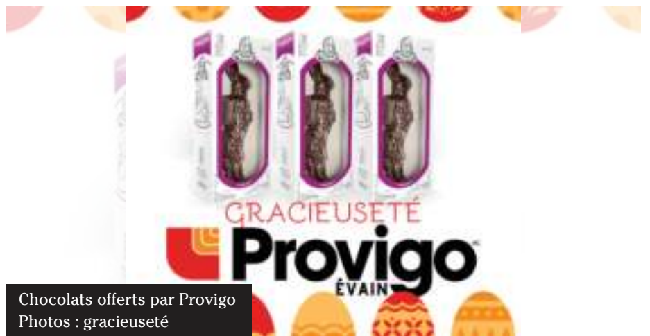
Chocolats offerts par Provigo