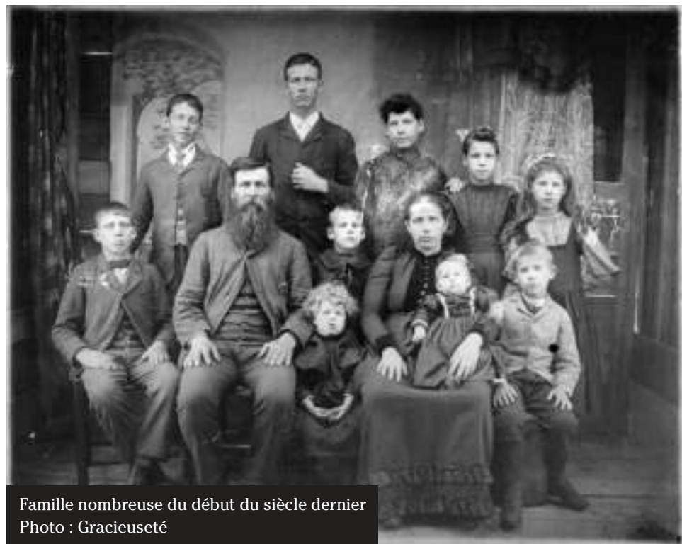
Famille nombreuse du début du siècle dernier

Les enfants lui fournissent sans cesse tout ce qui est nécessaire pour qu'elle ignore l'ennui. Du lever au coucher, du coucher au lever, elle a toujours à faire. Journées qui se répètent. Années qui se suivent.