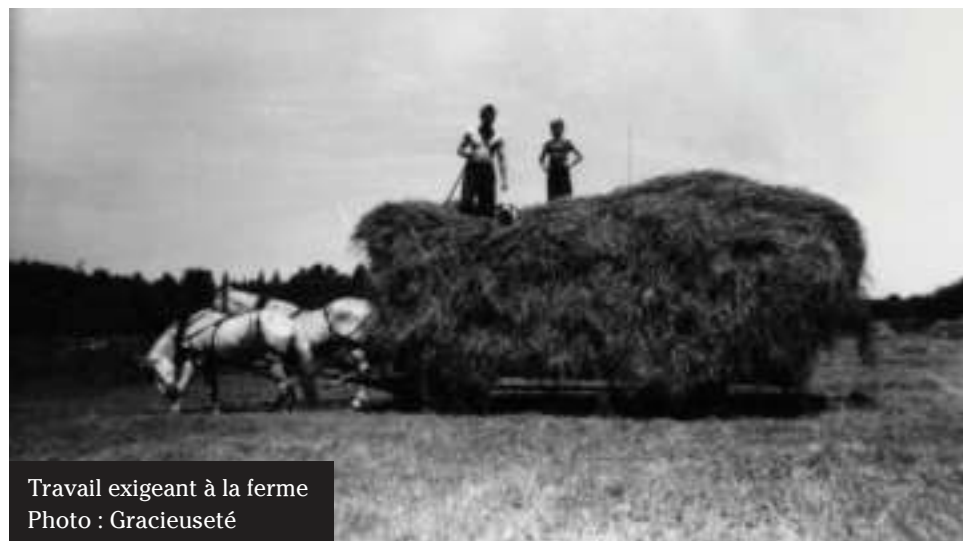
Travail exigeant à la ferme

Elle a sûrement ses moments de doute, des révoltes, des fatigues, personne ne le sait... Je la vois soumise. Elle fait de son mieux, elle donne ce qu'elle a reçu, honnêtement. Quelques prières la rassurent. C'est sa nourriture pour affronter le quotidien, toujours à recommencer : déjeuner, dîner, souper; ménage, lavage, repassage; infirmière, couturière, jardinière. Cent métiers, une profession : mère. On la disait prisonnière.