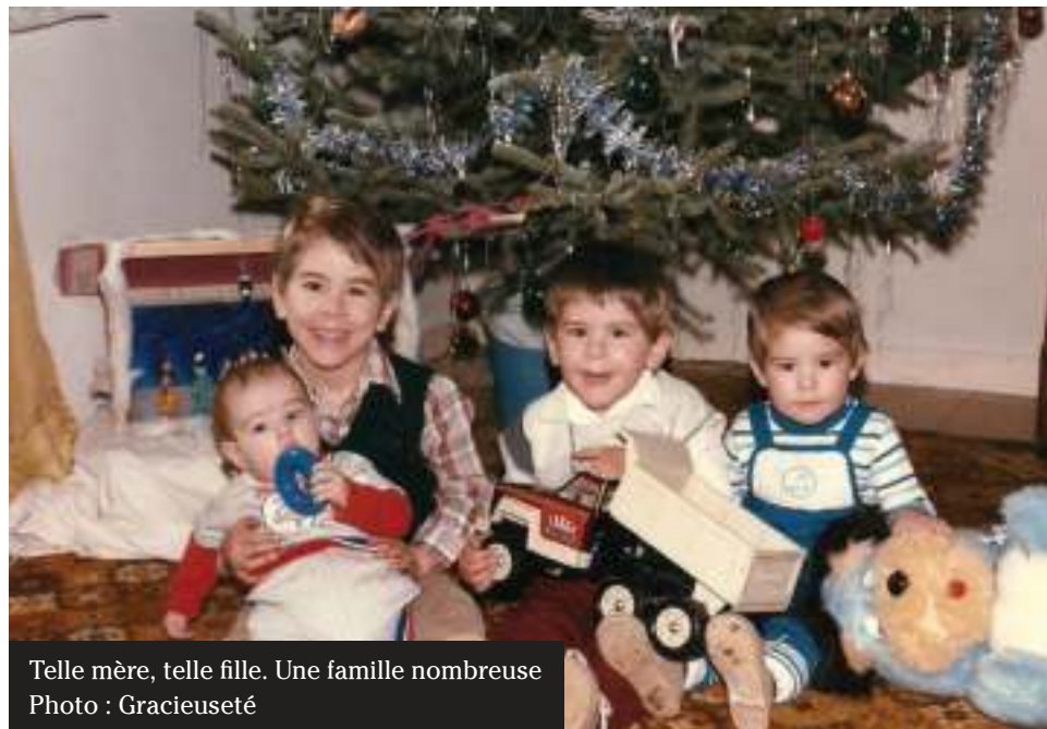
Telle mère, telle fille. Une famille nombreuse

À l'université, le destin me présente un homme auquel je m'unirai. Le vrai travail commence à l'intérieur, en moi. Pour l'attirer, je lui ai donné un enfant. Pour le garder, j'ai enfanté de nouveau, puis une troisième et une quatrième fois, tous des garçons. Soumission. Je ne suis pas capable de lui dire non. On me dit prisonnière.