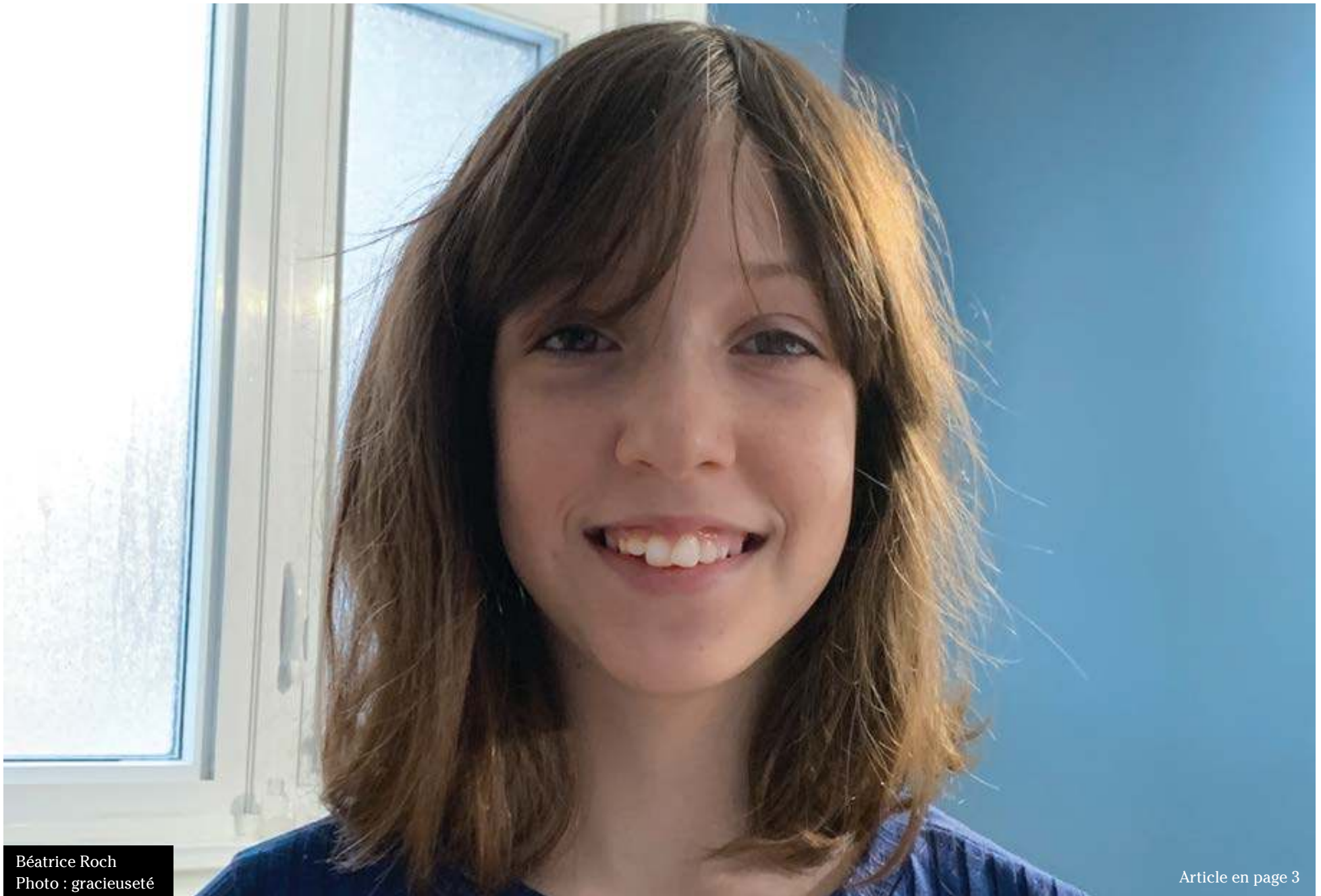
Béatrice Roch