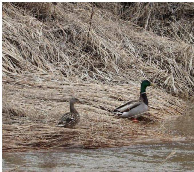
Un couple de canards mallards , appelés aussi canards colverts , aux abords du ruisseau Corona près du parc Victor, le 2 mai 2020.

Article paru dans le journal Ensemble pour bâtir, sur le Web en juin 2020 et dans le journal papier de l'été 2020.