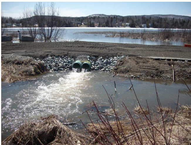
Rétablissement d'une voie à la circulation.