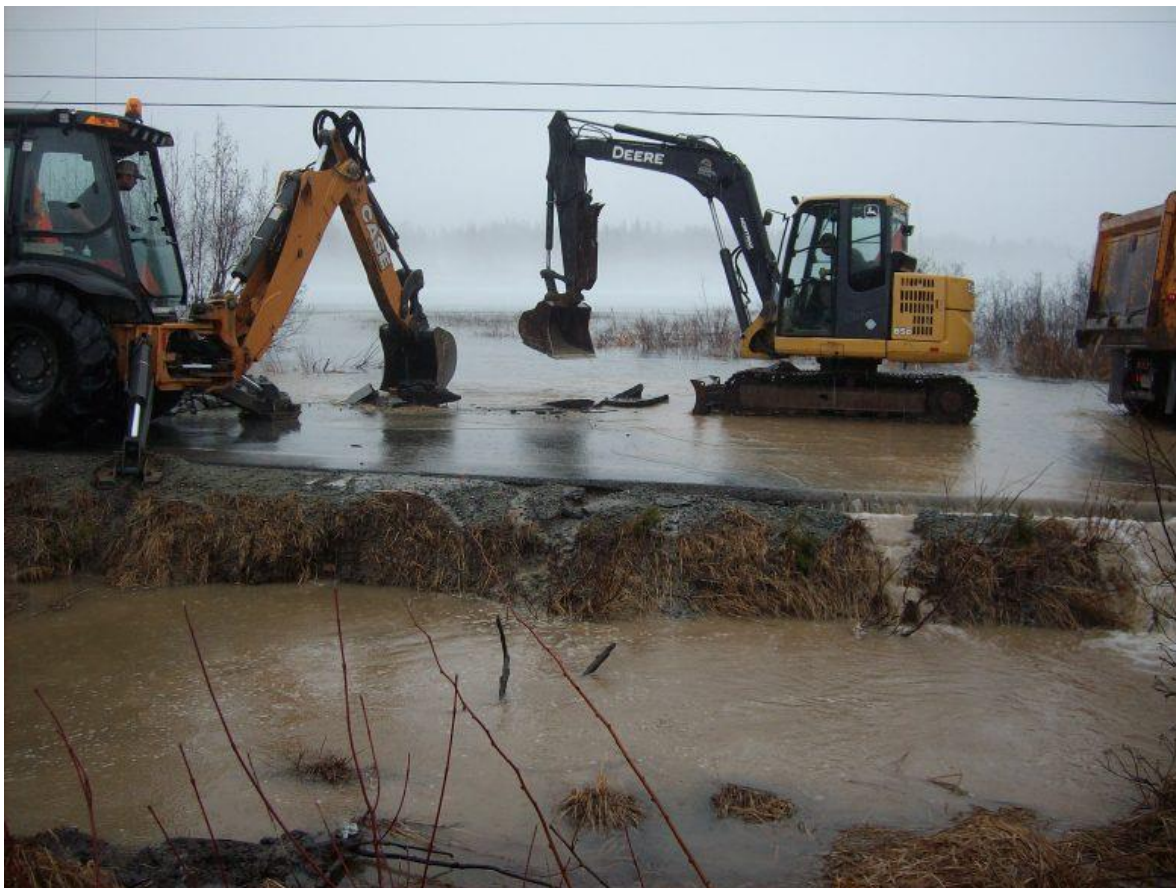
Travaux compliqués par le haut niveau d'eau du lac Hélène.

Les résidents de ce secteur ainsi que tous les automobilistes qui empruntent ce rang devront vivre avec cette situation encore plusieurs semaines. Les travaux d'installation d'un ponceau permanent ne se feront que lorsque le niveau du lac sera abaissé suffisamment.