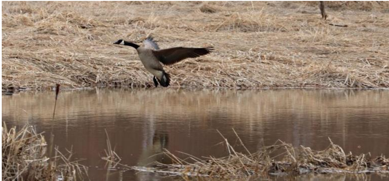
Une bernache canadienne au-dessus de la rivière Pelletier, au bout du chemin des Puits (rue Bourassa), le 2 mai 2020.

Voici quelques photos d'oiseaux observés ce printemps, près de cours d'eau à Évain.