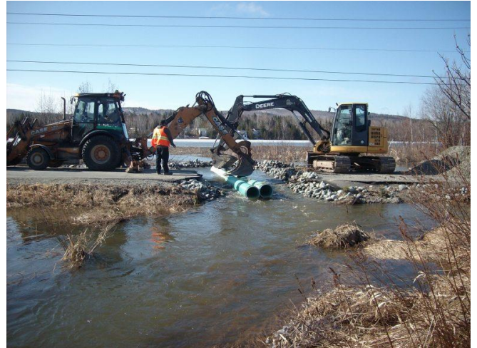
Installation de ponceaux temporaires afin de faire baisser le niveau du lac Hélène.