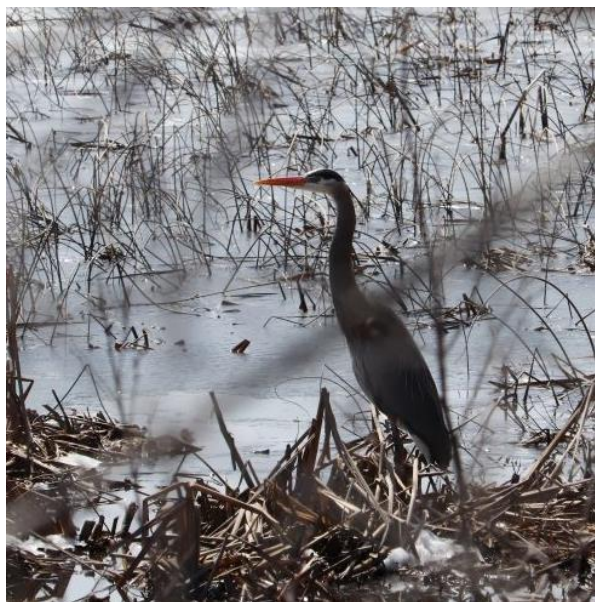
Un grand héron au bord du lac Hélène, le 28 avril 2020.