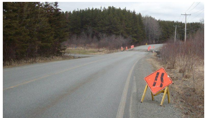
Réouverture limitée à la circulation.

Article paru dans le journal Ensemble pour bâtir , sur le Web en juin 2020 et dans le journal papier de l'été 2020.