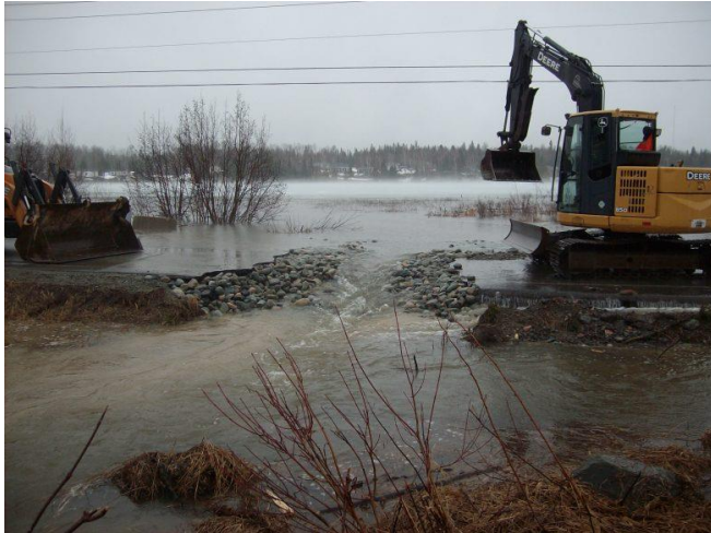
Un lit de roches permet le passage de l'eau.