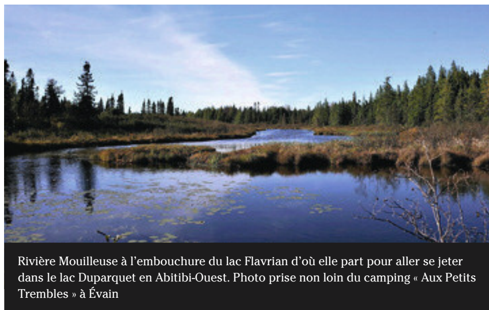
Rivière Mouilleuse à l'embouchure du lac Flavrian d'où elle part pour aller se jeter dans le lac Duparquet en Abitibi-Ouest. Photo prise non loin du camping « Aux Petits Trembles » à Évain