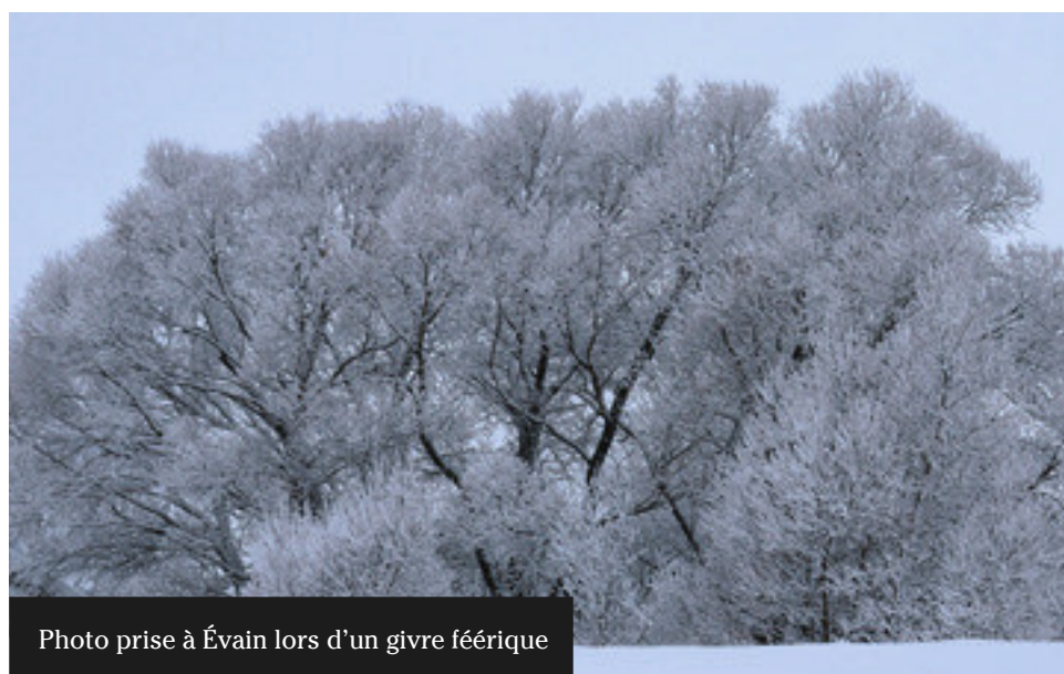
Photo prise à Évain lors d'un givre féérique