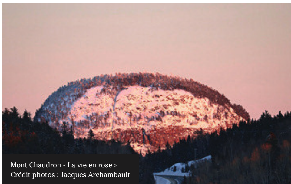
Mont Chaudron « La vie en rose »