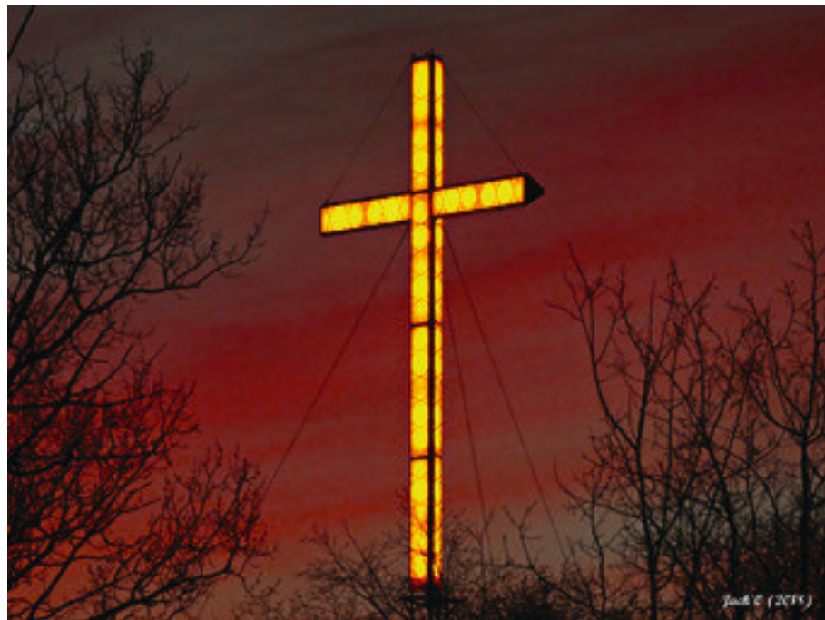
Trente-cinq ans déjà que cette croix lumineuse est un phare pour notre quartier.

Vous avez une belle photo et vous aimeriez la publier dans notre journal ainsi que sur notre Facebook? Faites-nous la parvenir à l'adresse du journal soit : info@journal.ensemble.org ou communiquez avec le journal au 819-797-7110 (2208) pour de plus amples informations. Il nous fera plaisir de la publier. Le tout sans frais.