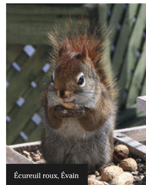
Écureuil roux, Évain