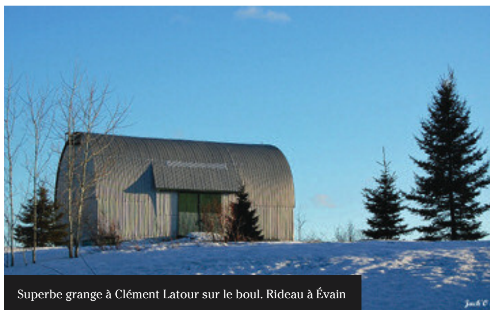
Superbe grange à Clément Latour sur le boul. Rideau à Évain