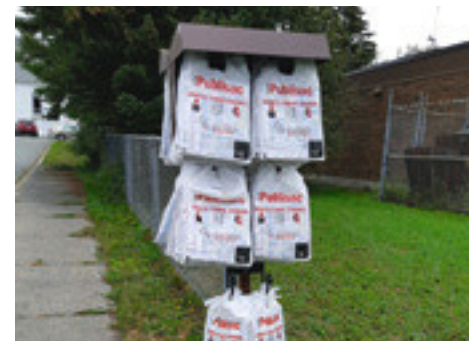
La distribution du Publisac change. Près de l'église d'Évain, côté ouest du bureau de poste