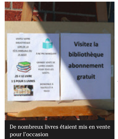
De nombreux livres étaient mis en vente pour l'occasion