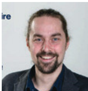
Bloc québécois Sébastien Lemire