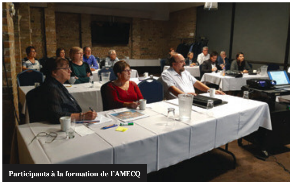
Participants à la formation de l'AMECQ

Pour un journal écrit fort et un média électronique plus développé, les membres de l'équipe se sont vu confirmer ce qu'ils savaient déjà : il faut plus de monde. La journée de formation a fourni de meilleurs outils à ceux qui œuvrent déjà et à ceux qui viendront s'ajouter.