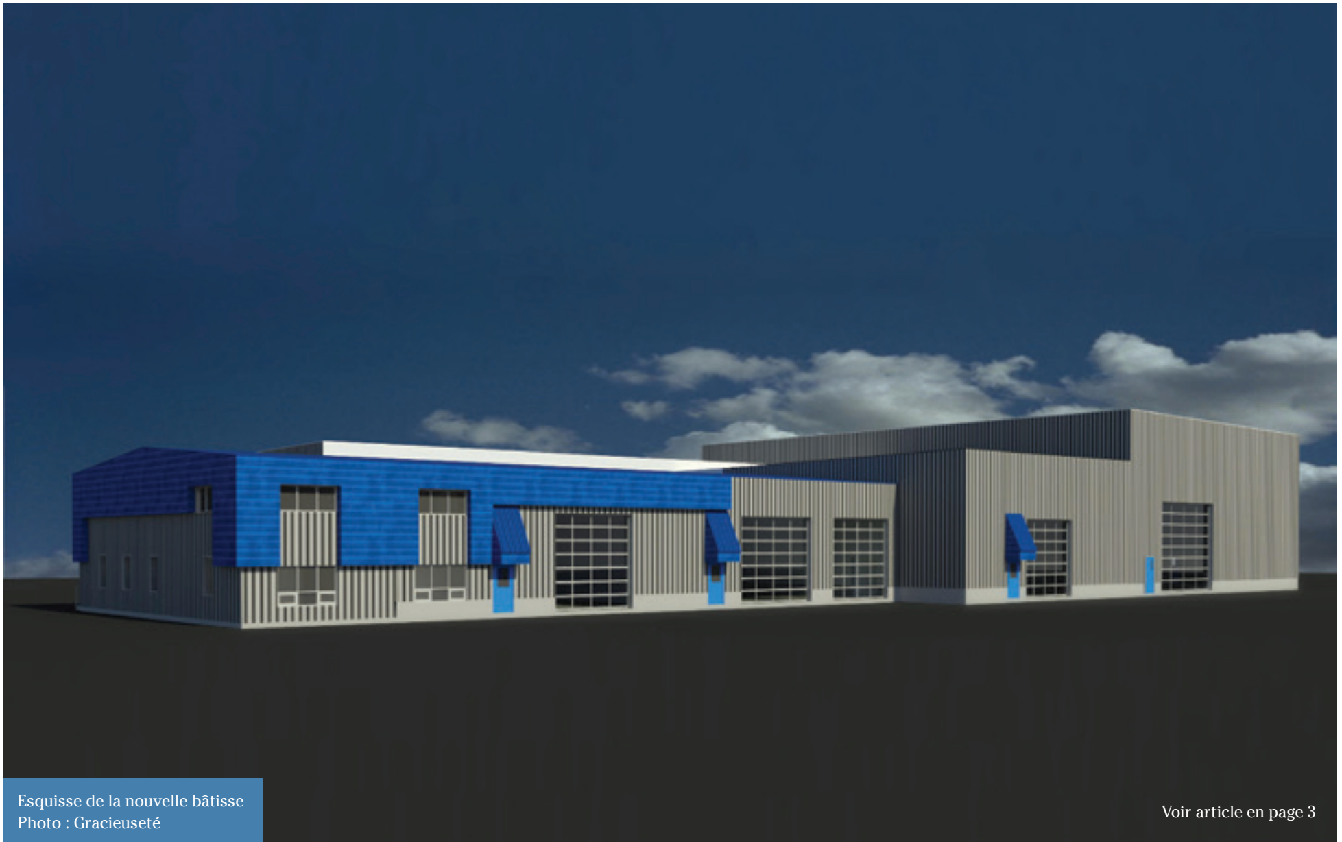
Esquisse de la nouvelle bâtisse