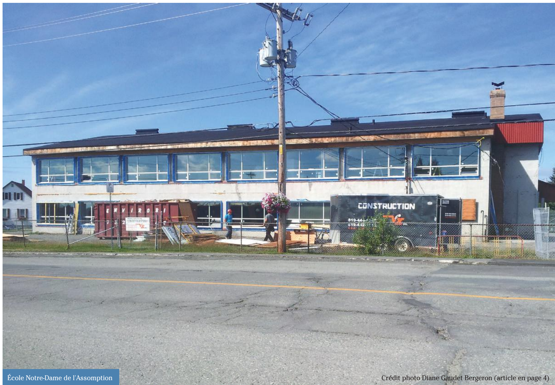
École Notre-Dame de l'Assomption