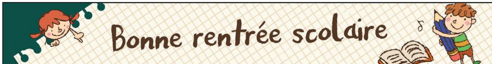
(article en page 4)