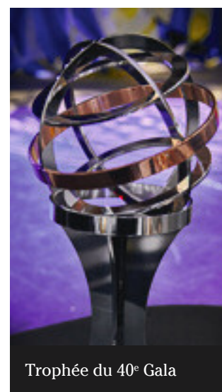
Trophée du 40 e Gala