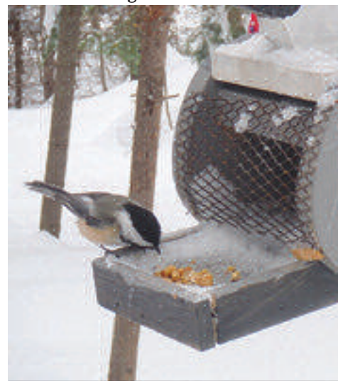
Mésange à tête noire

Plus la température descend, plus ils doivent manger. C'est là que nos graines de tournesol et le gras suspendu à nos mangeoires leur sont utiles.