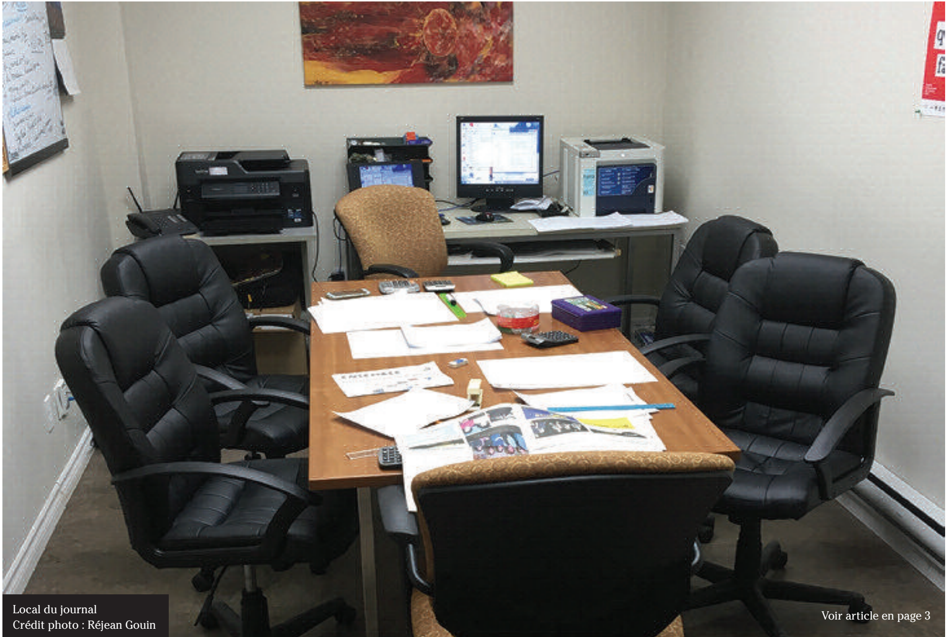
Local du journal