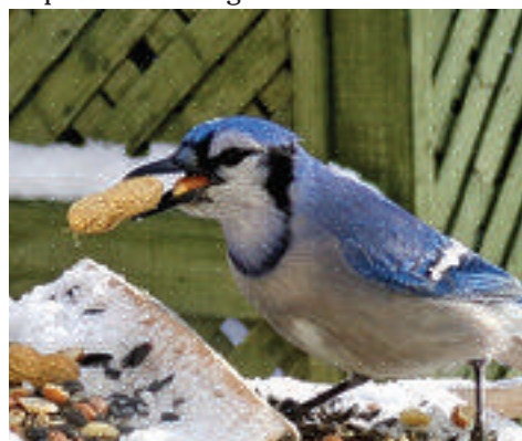
Geai bleu

On le voit bien, les petites mésanges, à -30 Celsius, font le va-et-vient sans arrêt aux mangeoires. Certains futés ont même pensé à cacher de la nourriture, comme les sittelles, les pics et les geais qui vont dissimuler de la nourriture sous des écorces d'arbres ou dans des trous sur les arbres en début d'automne ou par temps plus clément. Se font-ils voler leur nourriture, oublient-ils où ils ont déposé leur butin? Je n'en sais rien... J'ai lu que le geai bleu peut s'empiffrer d'arachides avant de les transporter vers sa cachette pour maximiser sa dépense d'énergie.