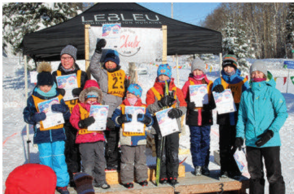
Le froid extrême n'aura pas rebuté tout le monde dont ces braves qui ont reçu un certificat de participation à cette grande fête mondiale.

2. Entrée quotidienne gratuite pour tous et registre d'événement