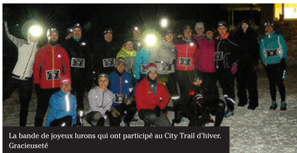
La bande de joyeux lurons qui ont participé au City Trail d'hiver.

Après la vague de froid intense vécue au début de février, les 24 participants étaient tous très heureux de bénéficier d'un temps plus doux et de profiter du nouveau foyer extérieur au Club de ski