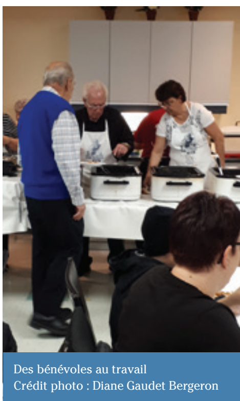
Des bénévoles au travail