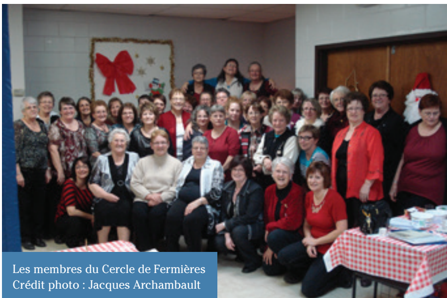
Les membres du Cercle de Fermières

Joyeux Noël et bonne année 2019, remplie de joie, bonheur et de santé.