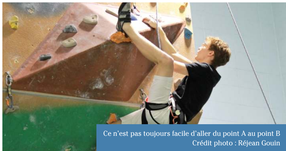
Ce n'est pas toujours facile d'aller du point A au point B

Si vous êtes curieux, vous trouverez de très belles photos d'escalade sur mur de glace au parc Aigubelle sur leur site Facebook, et toutes les informations sur leur site web www.rappeldunord.com