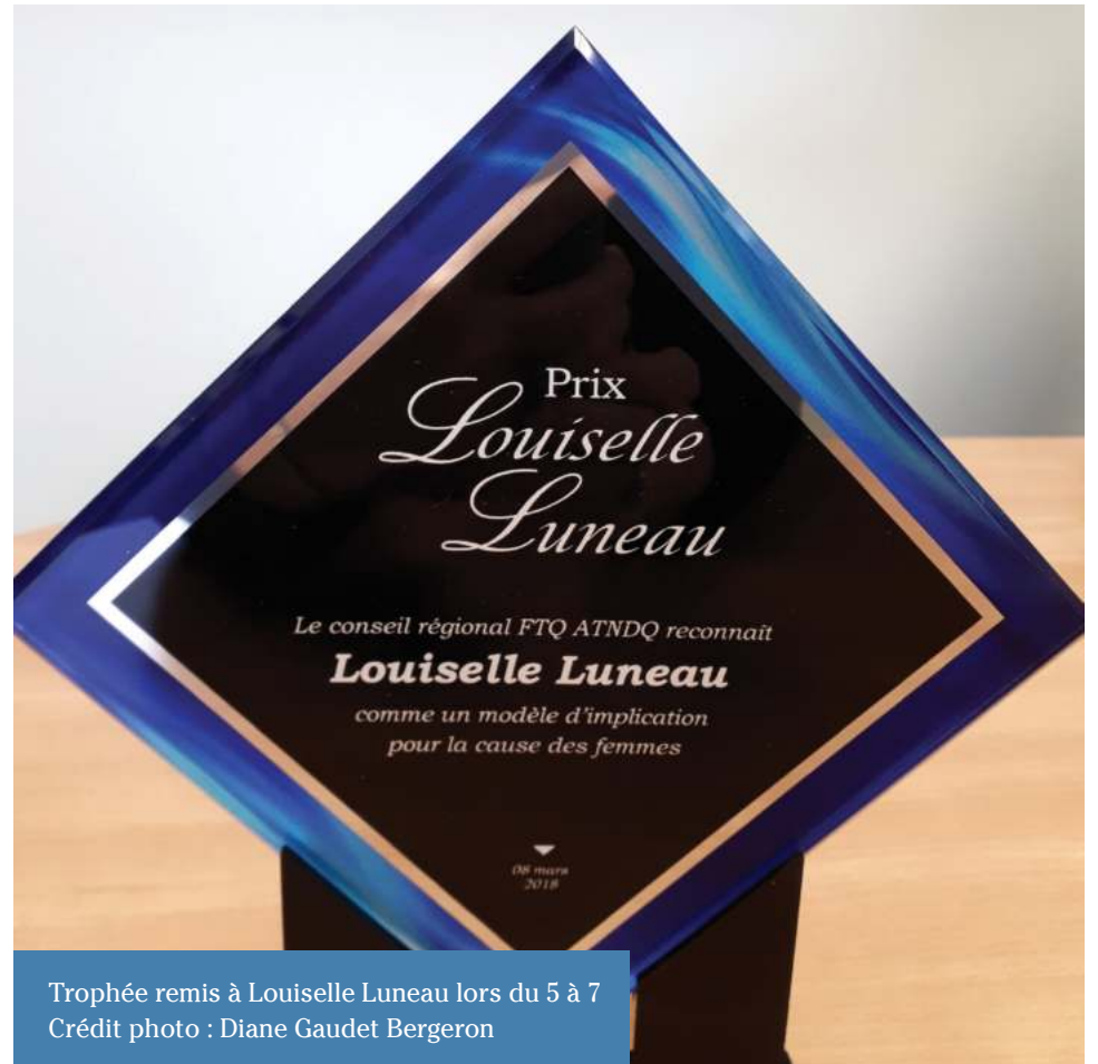
Trophée remis à Louiselle Luneau lors du 5 à 7