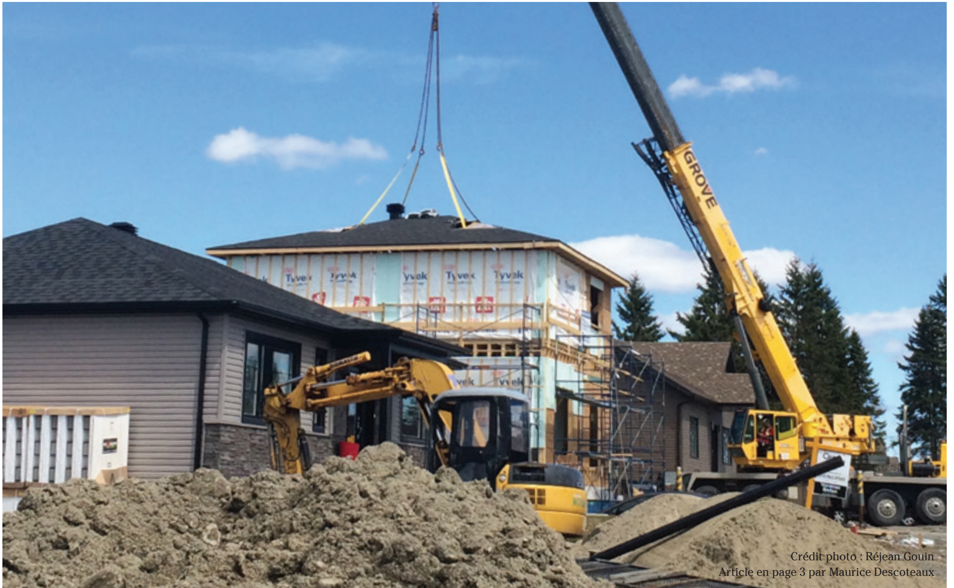
Article en page 3 par Maurice Descoteaux