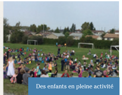
Des enfants en pleine activité