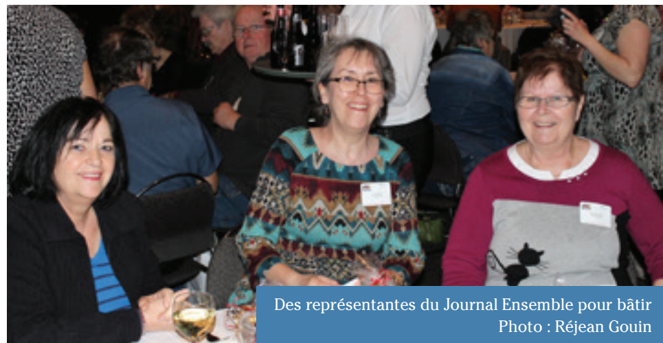
Des représentantes du Journal Ensemble pour bâtir