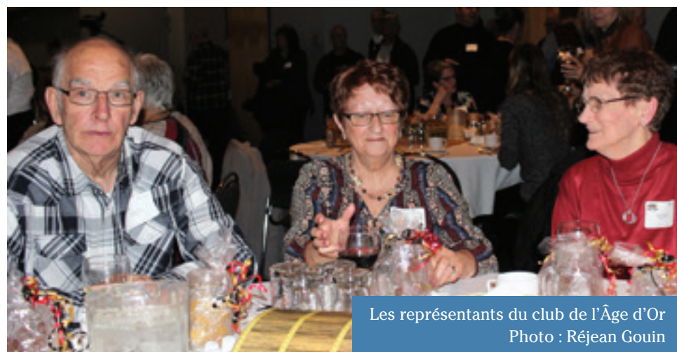
Les représentants du club de l'Âge d'Or