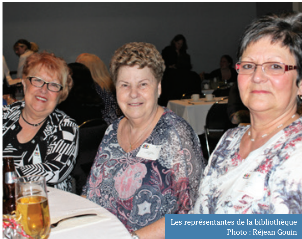
Les représentantes de la bibliothèque

C'est depuis le début de l'année 2000 que cette activité se déroule et cette 17 e édition aura été encore une fois à la hauteur.